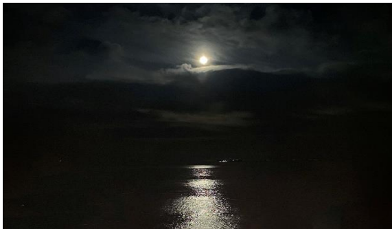
8階ロビーより眺めるムーンロード