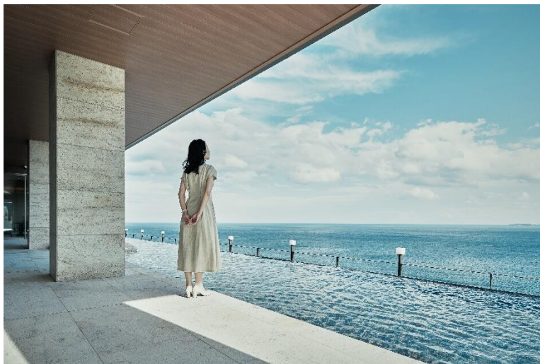
熱海・伊豆山 佳ら久 8階ロビー

ORIX HOTELS & RESORTSの熱海・伊豆山 佳ら久は、「水天一碧の情景が時を満たす かけがえのないひととき。」をコミュニケーションコンセプトに、紺碧の相模湾を一望しながら、露天風呂に憩い、山海の幸に歓びを覚える宿です。この度、日本の伝統芸能である能楽の鑑賞やセミナー、ワークショップ等を佳ら久でお愉しみいただける満月の夜・一夜限りの貸し切りイベントを開催いたします。相模湾を一望するロビーの海景をバックに、静岡県の三保の松原を舞台とする演目「羽衣」の一部実演と、ダイニング「六つ喜」にて「羽衣」のストーリーを取り入れたこの日だけの特別和会席・スイーツをご提供いたします。