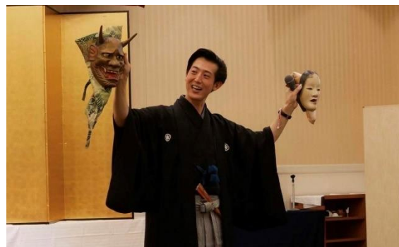
ワークショップイメージ